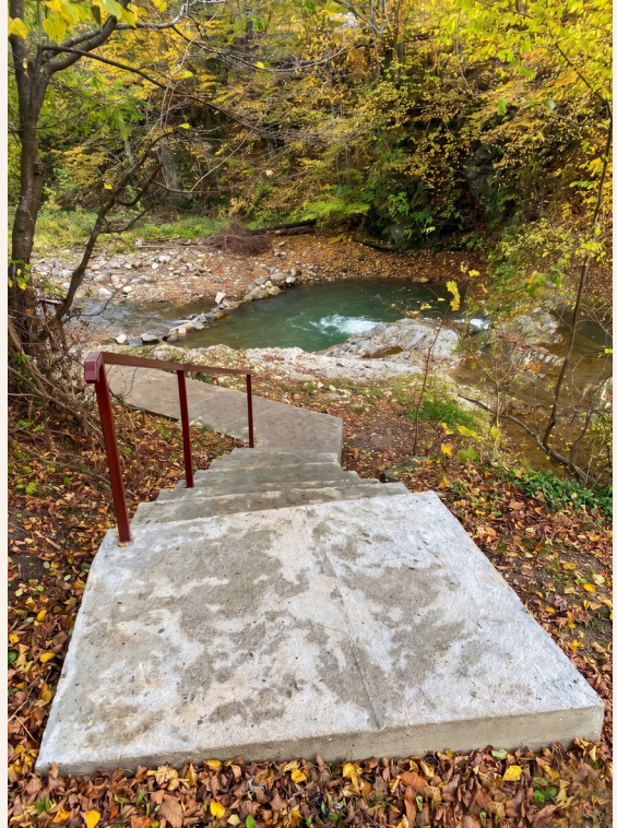
מדרגות למעיין הותקנו ע"י 'אגודת אהלי צדיקים' בראשות הרב ישראל מאיר גבאי

זכותו הגדולה תגן עלינו ועל כל ישראל אמן.