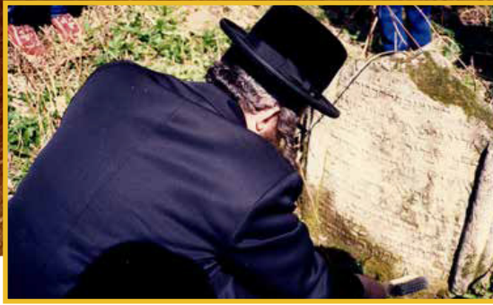
שר הדתות של אוקראינה מוסר לר' אנשיל באב"ד את פרטי ראשי הערים בקאסוב, וויזניצא וזבלטוב