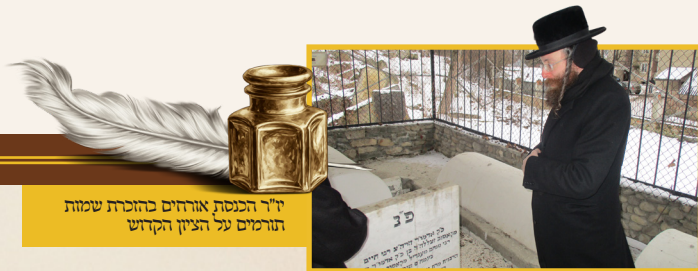
ז"ר הכנסת אורחים בהוכרת שמות תורמים על הציזן הקדוש