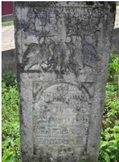
מצבת יוטא בת ר' יוסף מו"ץ

עד כאן. נוסח מצבתו: פ"נ איש תם וי"ש [וירא שמים] המופלג החסוד מו' יוסף במוהר"ר משולם נפ' ער"ח ניסן תרל"ג תנצב"ה.