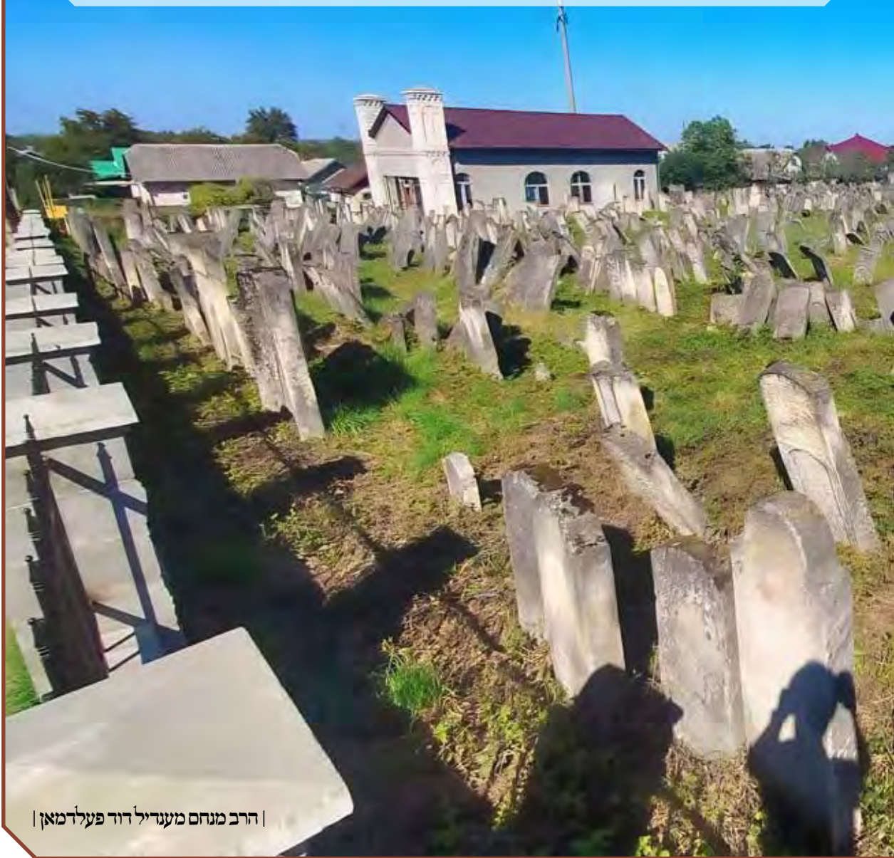
| הרב מנחם מענדיל דוד פעלדמאן |