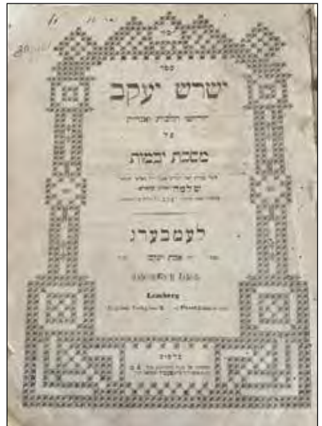
שער הספר 'ישרש יעקב' לבעל הבית שלמה'