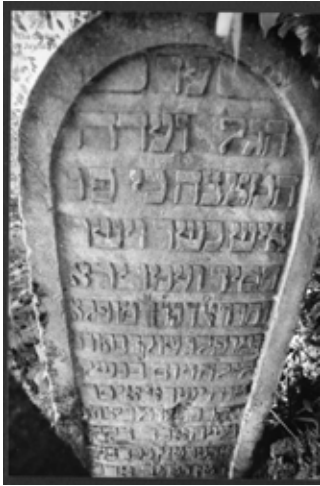
מצבת רבי ישראל איסר גרוס בוויזניצא