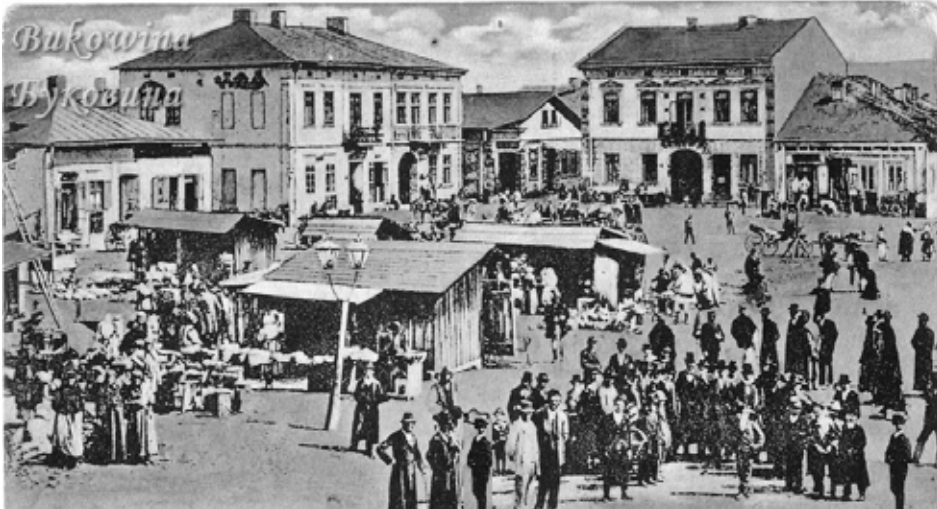
ככר השוק בעיר ויזניצא

באותה עת הנהיגו השלטונות סדרים חדשים במערכת המשפט והקניין, וביתר שאת בענייני רישום המקרקעין והנחלאות. בעבר, היו ענייני הירושה והחלוקה נחתנים בתוך הקהילות פנימה